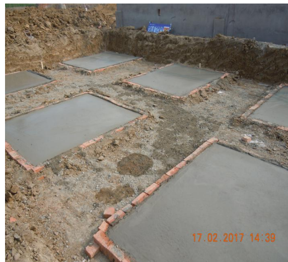
门卫室基础垫层浇筑