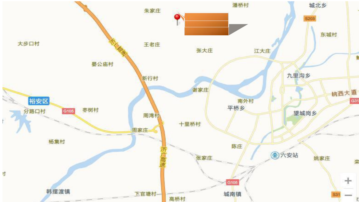
图 1.1.1 项目区地理位置示意图

项目区地理位置示意图见图 1.1.1。光大生物能源（六安）有限公司裕安 30MW 生物质热电项目特性表 1.1.1。